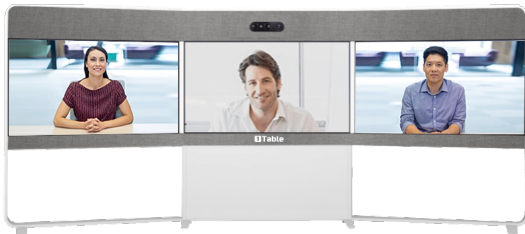
图四：沉浸式会议效果图