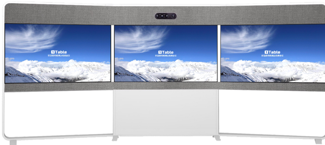
图一：雅清大观 65T Pro 正视图

65T Pro 为客户提供业界领先的视频和音频体验，新功能实现了更智能的会议、更智能的演示功能以及更智能的会议室和设备集成，进一步消除了在会议室使用和部署视频的障碍。把您的会议空间转变为视频协作中心，无论是用于连接世界各地的团队还是用于本地会议。