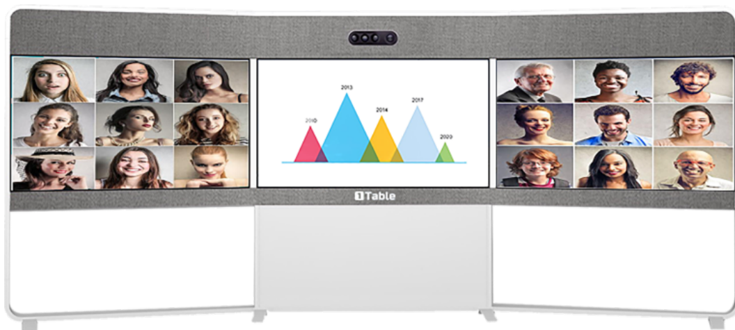
图六：双屏幕 18 个参会方均等显示和 1 路 PPT 共享