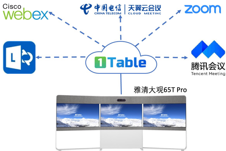
图七：通过 1Table 平台参加跨平台会议