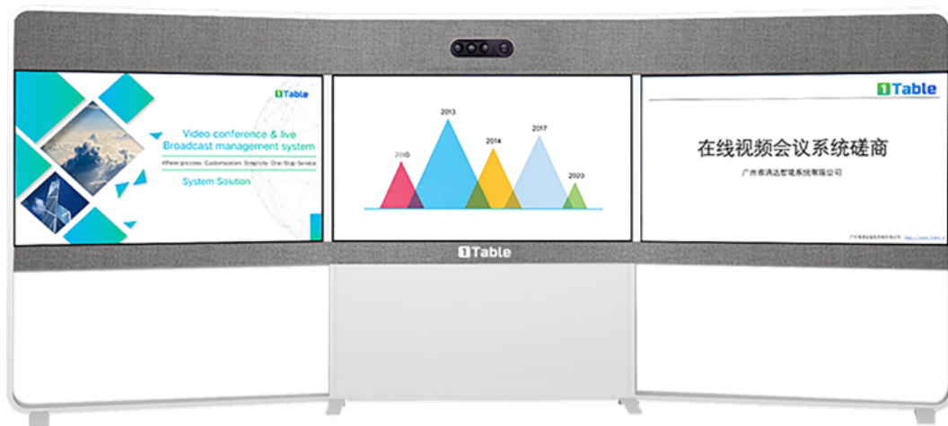
图五：多方 PPT 共享效果图

注：腾讯会议 Rooms 的会议功能，详见腾讯官方文档，部分功能还在开发试用中。